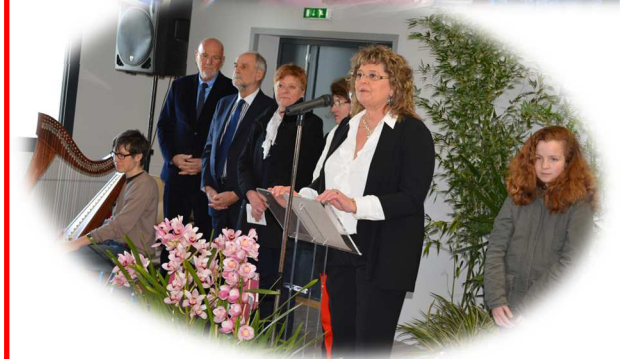
La Salle a été inaugurée le 5 mars dernier.