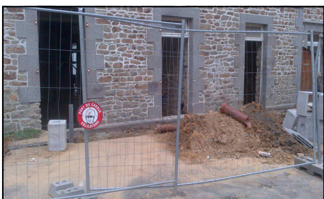
Ecole des Champs Géraux

Néanmoins comme chaque année à cette époque, il y avait foule dans la cours de l'école de la Petite Courcière, où les plus petits montraient parfois quelques signes d'anxiété en faisant leurs premiers pas dans la grande école. Les plus grands quant à eux, déjà habitués à cet exercice annuel, affichaient une mine enjouée à l'idée de retrouver copains et copines.