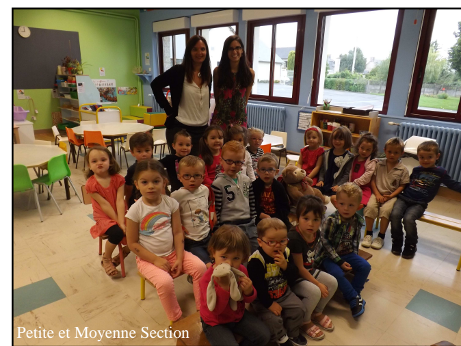
Petite et Moyenne Section

Nous souhaitons aux enfants une année studieuse.